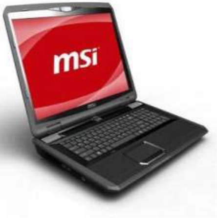
نوت‌بوک مخصوص بازی جدید MSI GT780