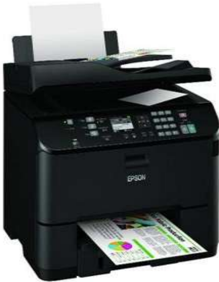
جایگرهای جدید اپسون در جنگس 2011