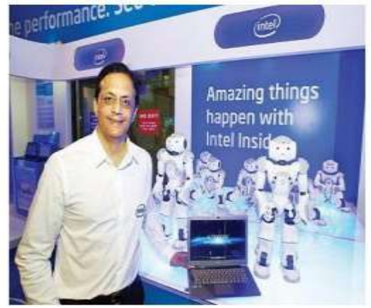
شرکت اینتل از آنرا بولک‌های جدید خود برده برداری کرد