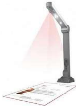
اسکنر جدید متن و تصویر گداک