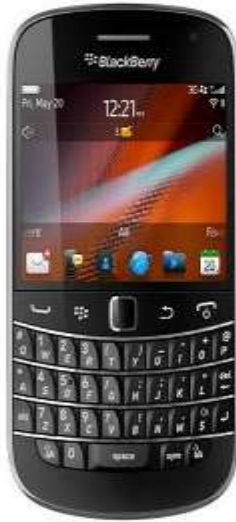
گوشی جدید Bold 9900 بلک‌بری