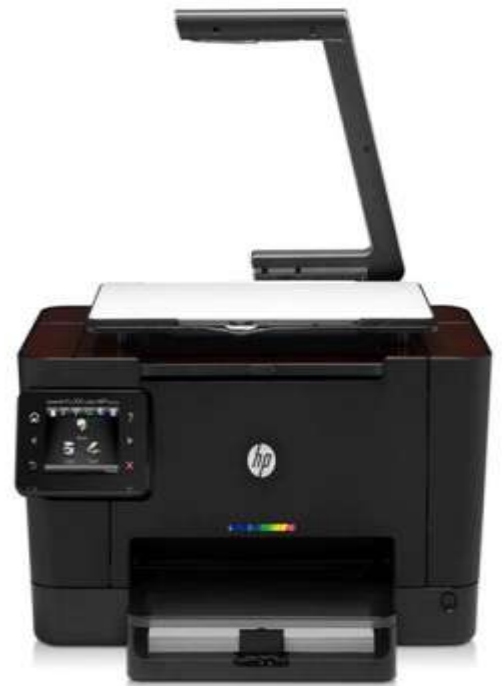
شرکت اچ‌پی جایگر جدیدی با قابلیت اتصال به فناوری گلاود رونمایی کرد