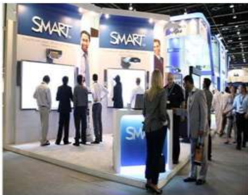
وابت‌بردهای آموزشی تعاملی شرکت Smart