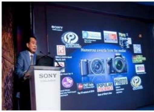
مدیران سونی در نمایشگاه مشغول معرفی دوربین‌های جدید