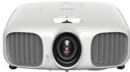
دو محصول بروزگتور جدید اپسون معرفی شدند