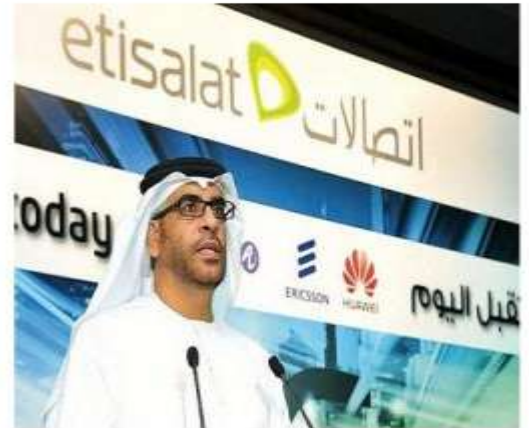
شرکت اتصالات وعده فناوری‌های 4G روی نوت‌بوک داده است