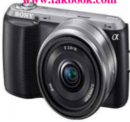
دوربین Sony Alpha NEX C3